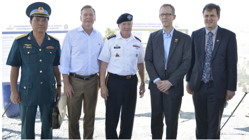
General Dempsey Project visit

U.S. General Martin Dempsey, Chairman of the Joint Chiefs of Staff, visited the Project site on August 15. General Dempsey hailed the project as an important milestone in the bilateral relationship and for the people of Danang: he stated, "I am so impressed with the progress being made. The U.S. Defense Department fully supports, and will continue to support this important initiative."