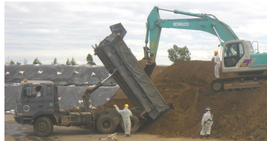
Tập kết vật liệu Giai đoạn 2