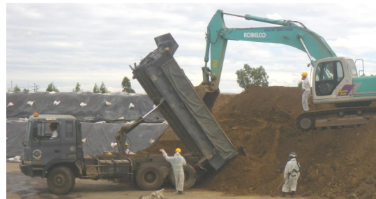
Stockpiling Phase 2 material

With the Danang rainy season quickly approaching, remaining excavation activities have been suspended until the 2015 dry season. Preparations have begun to secure the site for the rainy season, including several erosion control measures.