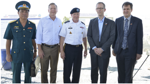
Tướng Dempsey đến thăm Dự án

Vào ngày 15 tháng 8, Đại tướng Martin Dempsey, Chủ tịch Hội đồng Tham mưu Liên quân Hoa Kỳ, đã đến thăm công trường Dự án. Đại tướng Dempsey ca ngợi Dự án như là một cột mốc quan trọng trong mối quan hệ hợp tác song phương và đối với cư dân Đà Nẵng. Ông cho biết, "Tôi có ấn tượng sâu sắc với tiến độ đã đạt được. Bộ Quốc phòng Hoa Kỳ hoàn toàn ủng hộ và sẽ tiếp tục hỗ trợ sáng kiến quan trọng này."