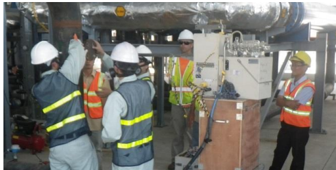
CPVN lấy mẫu hơi từ dòng chảy ra của hệ thống xử lý

Các nhà thầu của USAID quan trắc, kiểm tra và thử nghiệm rộng rãi môi trường (không khí, nước, đất) nhằm bảo vệ môi trường cùng sức khỏe và an toàn của cộng đồng bên ngoài vùng Dự án. Phối hợp chặt chẽ với các nhà thầu của USAID, Bộ Quốc phòng Việt Nam cũng thực hiện quan trắc độc lập các hoạt động của Dự án đối với đất, không khí và nước.