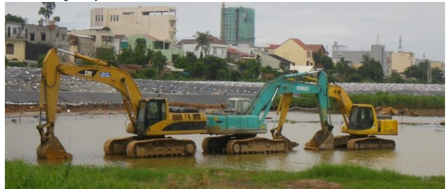
Sen Lake after heavy rain

The temporary stockpiles will be maintained and monitored for the duration of the Danang rainy season.