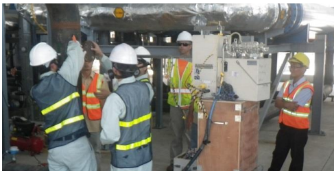
GVN collecting vapor samples from treatment system effluent

USAID contractors conduct extensive monitoring, inspection and testing of environmental media (i.e., air, water, soil) to protect the environment and health and safety of the community outside the Project site. In close coordination with USAID, the Vietnamese Ministry of National Defense also conducts its own independent soil, air and water monitoring of Project activities.